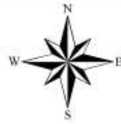
Схема градостроительного зонирования